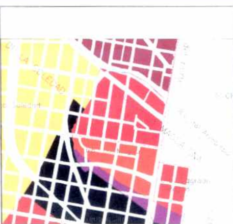
PLANO DE URBANIZACIONES

La circunstancia de no quedar sobre vías arterias oriente-occidente, pudo haber sido la causa de su excepcional conservación. Las áreas verdes de antejardines y calles ofrecen, junto con la escala de sus viviendas de dos pisos un panorama urbano singular.