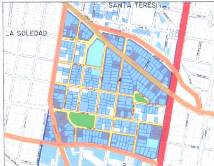
Inmuebles de Interés Cultural - MORFOLOGÍA EN PLANTA